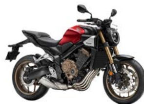
ABS + TBC