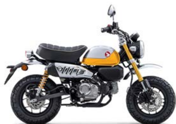
Z 125 MA