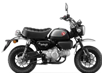
Prikazane cijene su sa uračunatim PDV-om