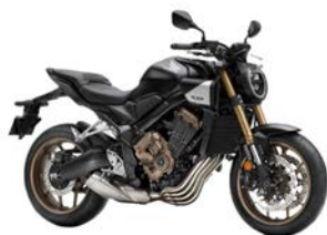
CB 650 R