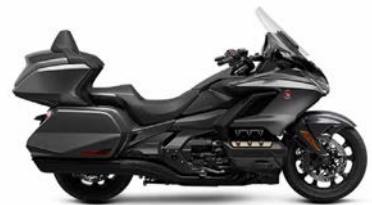
Gold Wing Tour

< Cijena modela sa automatskim mjenjačem (DCT) >